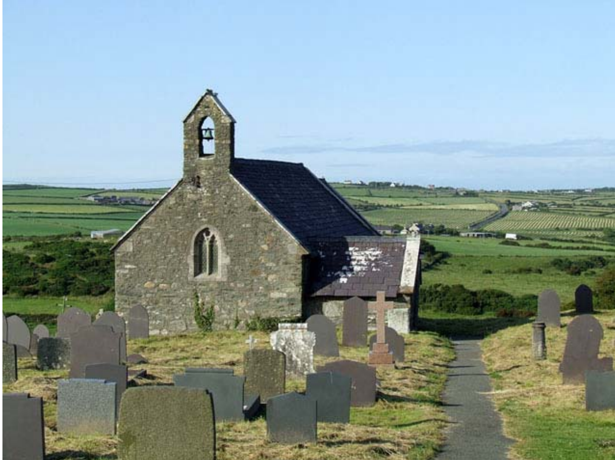
Святой АМЕТЛУ (МАЙТЛИ), отшельник из Англси (VI век, память 26 декабря)

Валлийские генеалогические списки, посвящённые святым, считали Святого Майтли (Maethlu) сыном Карадока Врейхвраса, сына Ллира Марини, от Тегай Эйврон. Таким образом, он приходился братом валлийским святым Кадварху, Каурдаву и Тангуну, и относился к пятому поколению святых – потомков короля Коэля Старого.