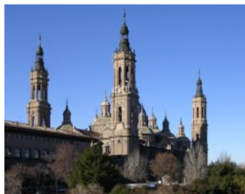
Сарагоса, базилика Божией Матери, что на Колонне

Он ненавидел всякую роскошь: его одежда была груба и проста, как и его еда, его жизнь была проста и строга. Красноречивый проповедник и острый спорщик, он мог убедить своего соперника своими аргументами и абсолютной искренностью.