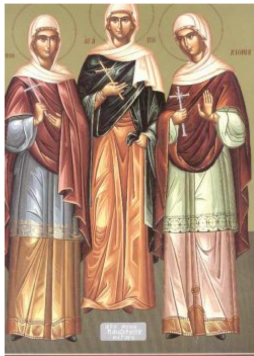
Мцц. Агапия, Ирина и Хиония