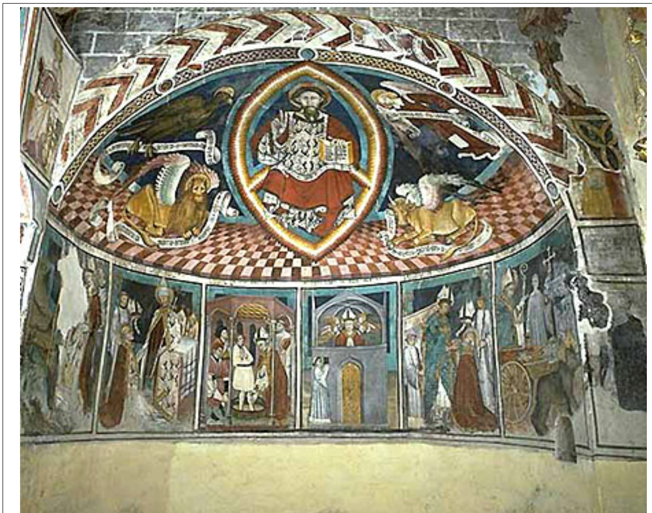
Часовня святого Эригия

Информационное панно ассоциации ``Белый мост'' ('Le pont blanc') на дороге из Манса (Manse) в Серр-Ришар (Serre-Richard).