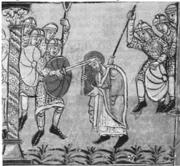
Ms. 231, Niedersächsische Bibliothek (Göttingen), X a 4

Несмотря на свой возраст и желание монашеского уединения, Бонифаций не прекратил, однако, своей деятельности. В 743 году он принял участие в большом германском церковном соборе, собранном в первый раз мажордомом Австразии Шарлеманем для того, чтобы урегулировать многочисленные проблемы, возникшие в Истинной Церкви в связи с реформами Шарля Мартеля и борьбой между аристократическими кланами. Эти расстройтва в церковной организации открыли путь к возрождению язычества и влиянию многочисленных шарлатанов, которые использовали наивность народа. Там