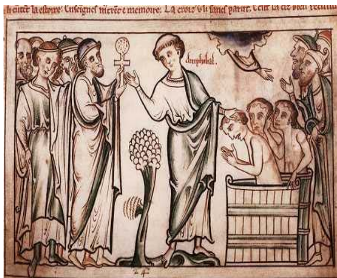
Святой Амфибал крестит британцев