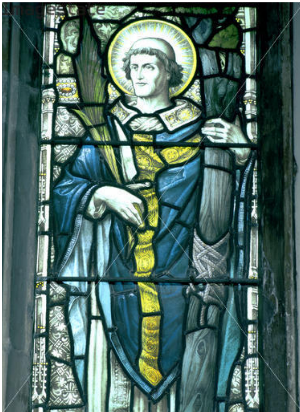
Святой Амфибал (витраж)